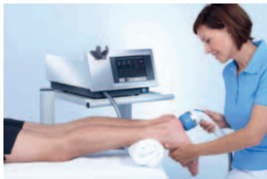
Triggerpunkt – Stoßwellen – Therapie mit dem ARIES Smart Focus

Bandscheibenprobleme, Rückenschmerzen, Ischias-Beschwerden, Schmerzen des Schulter-, Hüft-, Knie- und Sprunggelenks, Kopfschmerzen, Migräne, Gesicht-, Kiefer-, Zahnschmerzen, Nacken-Schulter-Schmerzen, Kalkschulter, Tennisellenbogen, Fer-